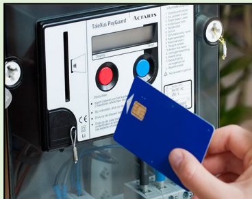
Ancien compteur à budget