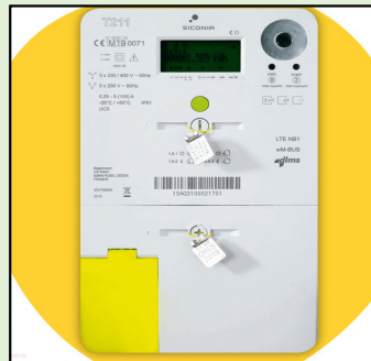
Nouveau compteur digital